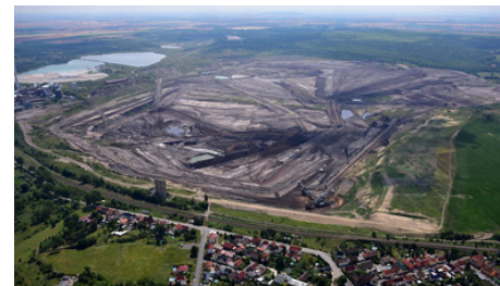
Lausitz: Braunkohle als Chemierohstoff?