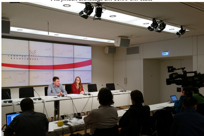
PK 05.12.: Stellungnahme zum Landesnahverkehrsplan