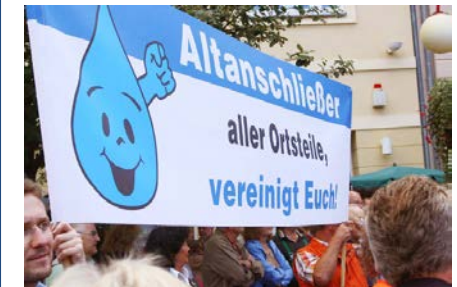
Zwei Jahre nach der Entscheidung des BVerfG lässt das Land die Altanschießer weiter warten