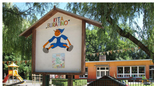
Kitas seit Jahren mit rechtswidrigen Satzungen