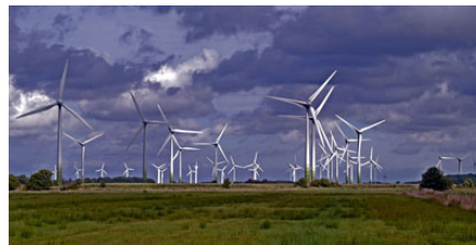
Brandenburg wird zur Industrielandschaft