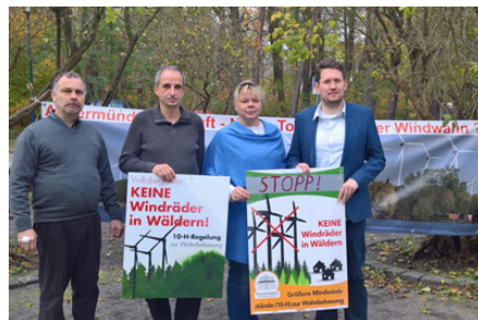
BVB / FW beim Windkraftsymposium am 04.11.

Das EEG als Selbstbedienungsladen: BVB / FREIE WÄHLER fordert Umstellung auf reinen Emissionsrechtelandel – Bürgerwindparks sind keine Alternative