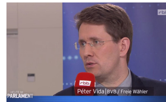
Interview „Heute im Parlament“ zum Thema E-Government